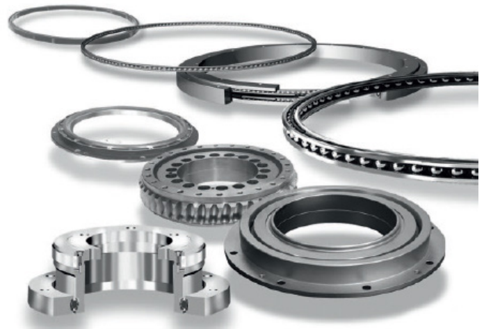
Franke bietet spezifische Lösungen bei einer flexiblen Werkstoffwahl.

Erstausgabe / Originalausgabe / Quelle: Fachzeitschrift: CAD CAM 11-12/2007