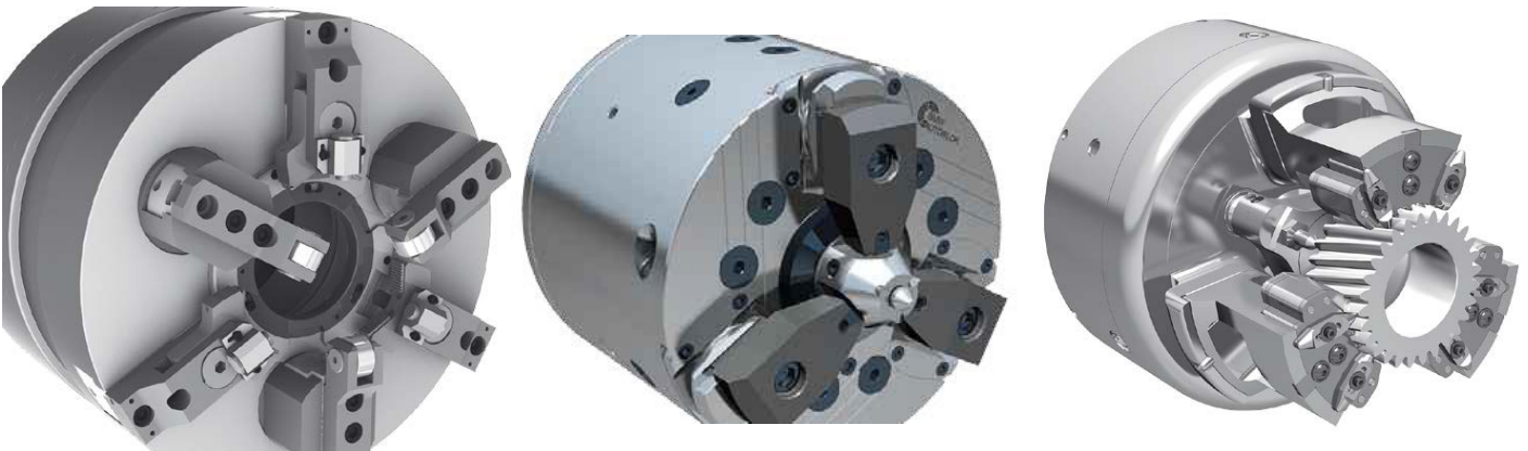
Spannwerkzeuge von SMW-AUTOBLOK dargestellt in SolidWorks

Die Erschließung und Verwaltung über Phoenix/PDM bietet uns enorme Zeitvorteile und reduziert Fehlerquellen.